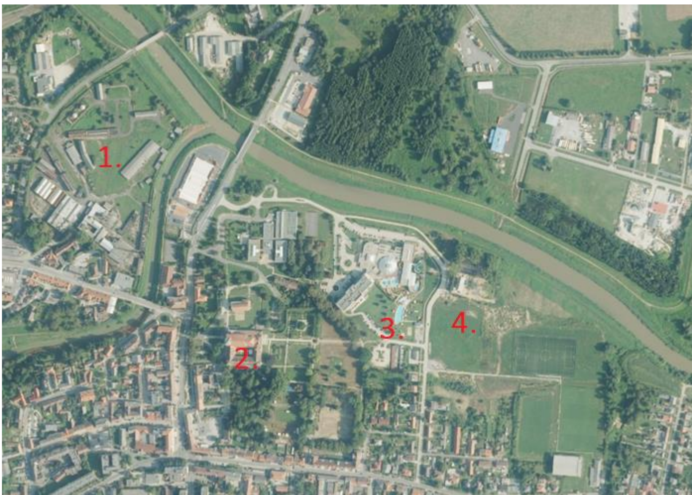
1. Ábra Szentgotthárd kiemelkedő fejlesztési potenciállal bíró területegységei

Az Szent Gotthárd Rekreációs Központ magja mind alapszolgáltatási területeit, mind működési helyét illetően a Gotthárd-Therm Fürdő és Idegenforgalmi Szolgáltató Korlátolt Felelősségű Társaság. Ezek stabilizálása és továbbfejlesztése azonban a vállalkozást döntő módon érdekeltté teszi abban is, hogy Szentgotthárd város fejlesztése mind a gazdasági, társadalom- és természetközveti fenntarthatóság szempontjait, mind a kultúrtörténeti alapokat figyelembe véve, adottságaihoz méltó módon történjék. Összességében egy komplex fejlesztési folyamatnak a „re-creo”-generátora legyen.